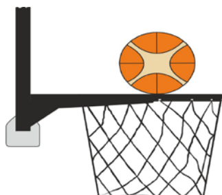
Διάγραμμα 2. Η μπάλα σε επαφή με τη στεφάνη

31-15 Κατάσταση: Η παράβαση παρέμβασης (basket interference) σημειώνεται από έναν αμυνόμενο ή επιτιθέμενο παίκτη κατά τη διάρκεια μιας προσπάθειας για καλάθι όταν ένας παίκτης αγγίζει το καλάθι ή το ταμπλό ενώ η μπάλα είναι σε επαφή με τη στεφάνη και έχει ακόμα τη δυνατότητα να εισέλθει στο καλάθι.